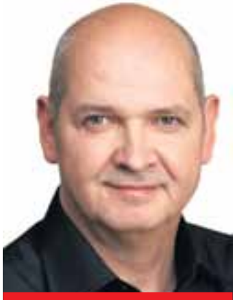
JAN MARIJNISSEN VOORZITTER SP