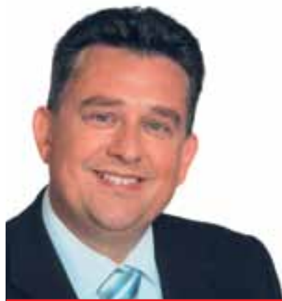
EMILE ROEMER, FRACTIEVOORZITTER SP

Het land is in crisis. Moeten we dan wel verkiezingen houden? Ik zie de grote problemen waar we voor staan. De haperende economie, die maar niet op gang wil komen. Veel zorgen maak ik me ook om het gebrek aan vertrouwen. In banken en financiële instellingen, in de mensen die ons geld beheren. Het gebrek aan vertrouwen in de bestuurders van woningcorporaties, onderwijs- en zorginstellingen. En vooral het gebrek aan vertrouwen in de politiek, dat die er is voor de belangen van gewone mensen.