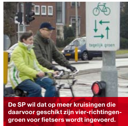
De SP wil dat op meer kruisingen die daarvoor geschikt zijn vier-richtingengroen voor fietsers wordt ingevoerd. •

heeft de wethouder op nieuwe vragen van de SP in de raadsvergadering van 11 december toegezegd dat de perrons in het eerste kwartaal van 2008 aangepast zullen worden. •